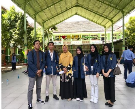
Gambar 1.1. peneliti melakukan observasi

Menurut Devri Suherdi dalam bukunya "Peran Literasi Digital di Masa Pandemi"(Suherdi 2021), literasi digital mencakup pengetahuan dan keterampilan pengguna dalam memanfaatkan media digital, termasuk internet dan alat komunikasi; ini mencakup kemampuan untuk menemukan, mengevaluasi, menggunakan, dan membuat konten digital dengan cara yang bijak dan cerdas.