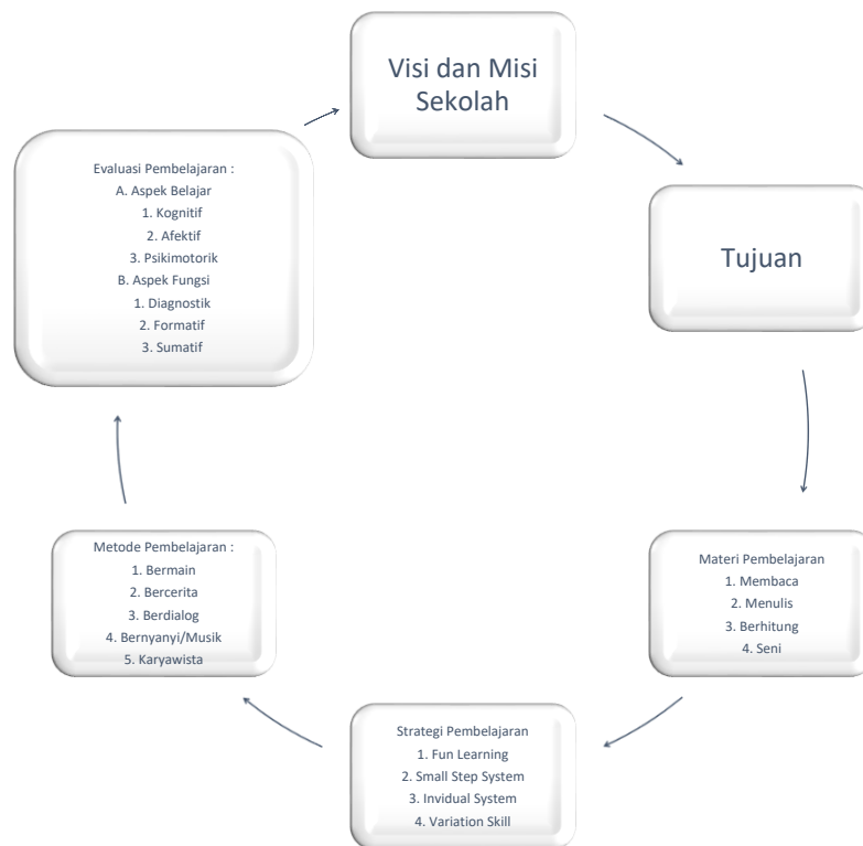
Gambar 1. Design Kurikulum biMba